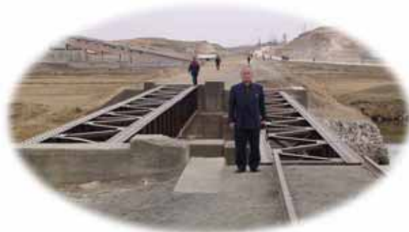
北側鐵道分断点 これより南数キロ地点が非武装地帯

鐵道路盤は完成し、後は枕木、線路の敷設を残しています。韓国製の大型ダンプが行き来し、非武装地帯の鐵道、道路工事が進捗していることを実感できました。