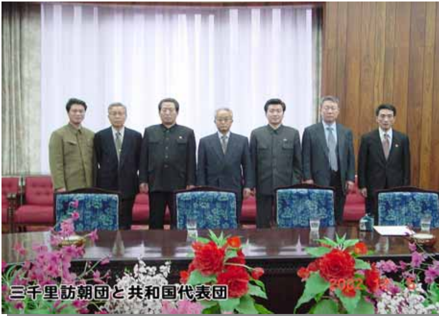
三千里訪朝団と共和国代表団