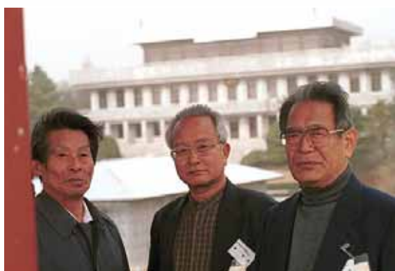
板門店（南側より・・・）